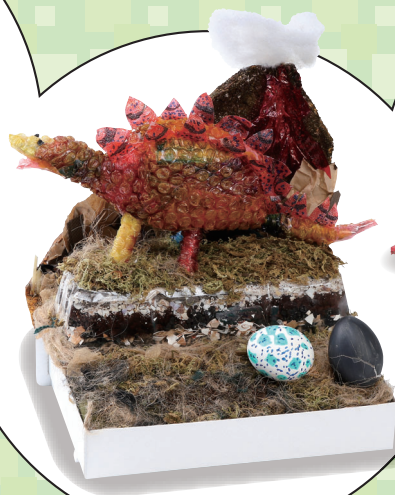
小学3・4年生の部 「ステゴサウルス発見!」