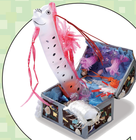
小学1・2年生の部 「SDGsな深海の宝箱」