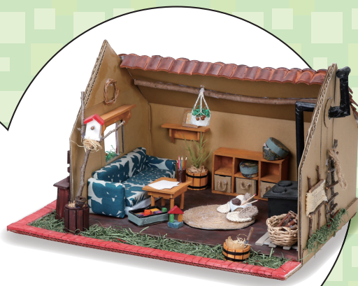
小学5・6年生の部 「幸せになる場所」