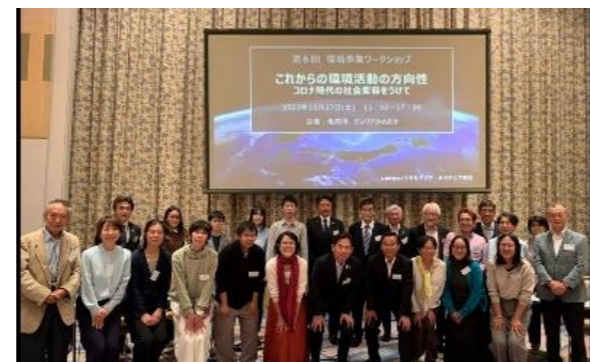
第6回環境ワークショップ (2023.10.27) 「これからの環境活動の方向性 コロナ時代の社会変容をうけて」 をテーマとして開催し、助成事業者13名が参加